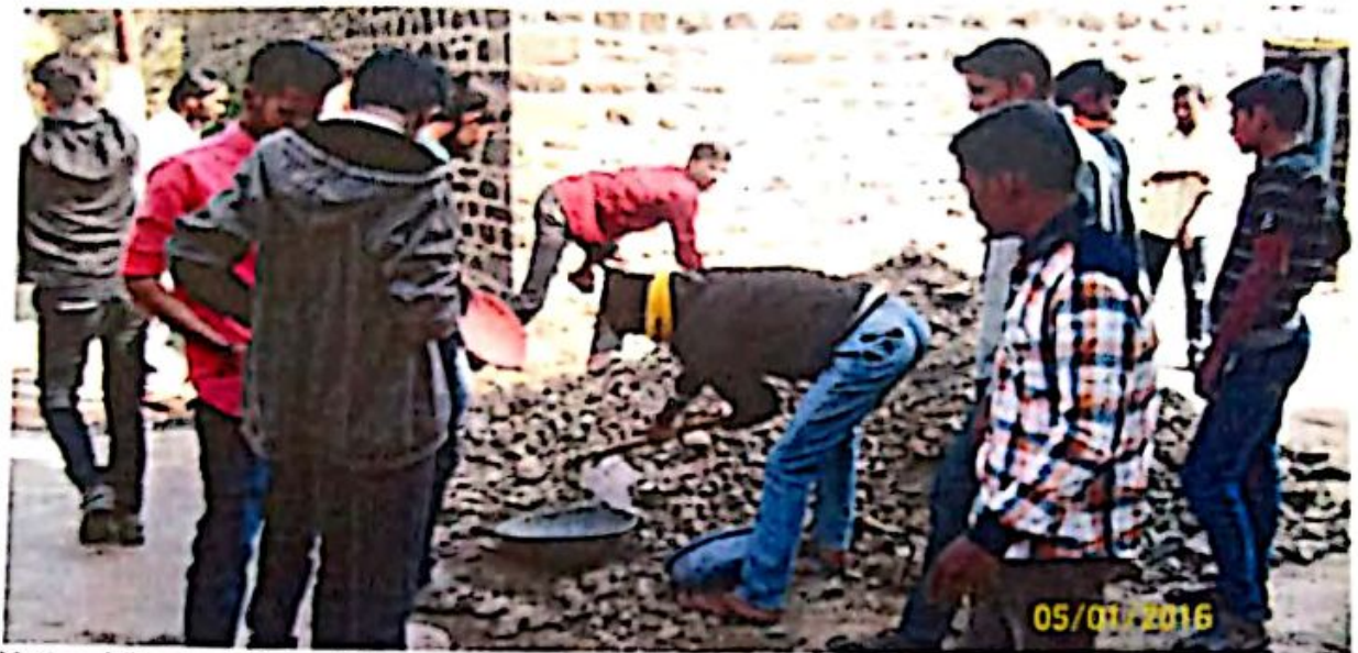
National Service Scheme Volunteers are repairing the road at Yelamwadi on 05/01/2016 in the Special Camp of National Service Scheme