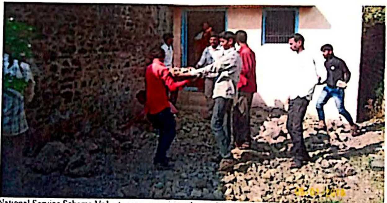
National Service Scheme Volunteers are repairing the road in front of Nursery School at Yelamwadi on 05/01/2016 in the Special Camp of National Service Scheme.