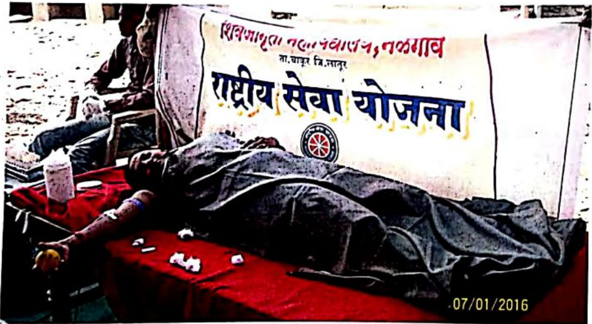
Citizen of Yelamwadi donating the blood in "Blood Donation Camp" at Yelamwadi on 07/01/2016 in the Special Camp of National Service Scheme.