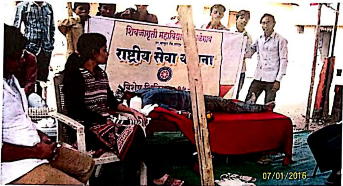
N.S.S. volunteer donating the blood in "Blood Donation Camp" at Yelamwadi on 07/01/2016 in the Special Camp of National Service Scheme. Doctors and N.S.S. volunteers are also seen.